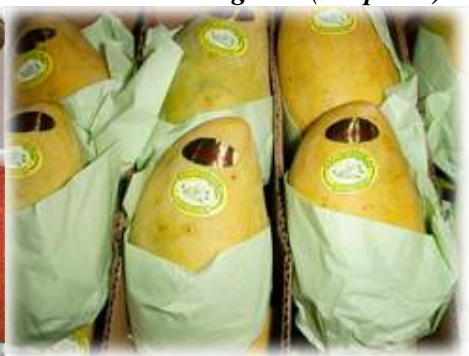
“Pelican Mangoes” (Filipinas)