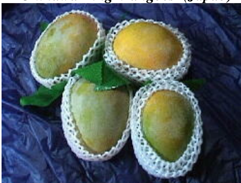
“Okinawa King Mangoes” (Japão)