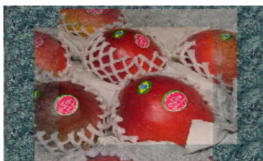
Manga brasileira (Tommy Atkins)