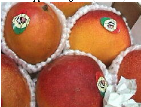
“Apple Mangoes” (México)