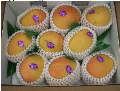
“Apple Mangoes” (Austrália)