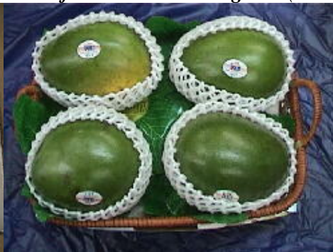
“ Californias Green Mangoes” (EUA)