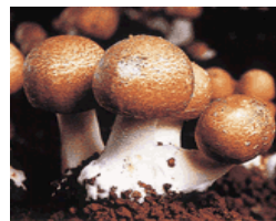
"Agaricus Blazei Murrii"

O cogumelo "Agaricus Blazei Murrii", que em japonês se chama "Hime Matsutake" pertence ao grupo dos cogumelos do tipo "AGARICUS".